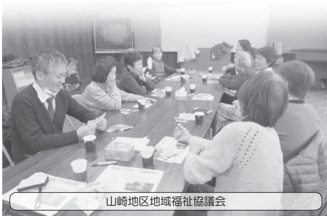
山崎地区地域福祉協議会